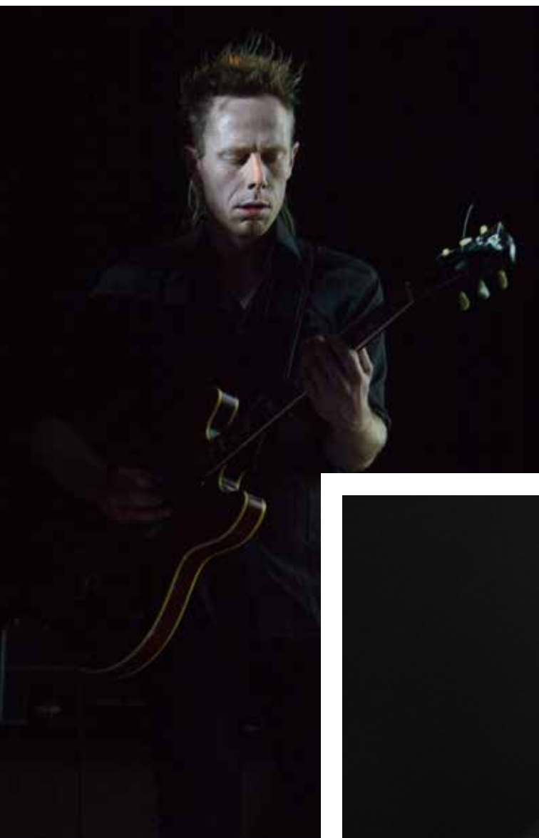
STIAN WESTERHUS / FESTIWAL JAZZ JANTAR 2012