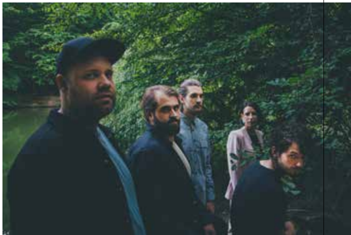
TROKUT / FOTO. MARINA UZELAC

W Polsce rokrocznie organizuje się ponad 100 festiwali jazzowych, ale czytelnicy magazynu „Jazz Forum” to właśnie Jazz Jantar uznali za najlepszy festiwal jazzowy 2021 roku (wcześniej przez kilka lat Jazz Jantar lokował się w pierwszej piątce). Dodajmy, że Klub Żak zdaniem czytelników magazynu należy do trójki najlepszych Klubów Jazzowych w Polsce.